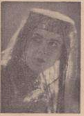
ایبزی بونوریه کوریم

بیلان آلمیش فونوتک بارایمی ویرجه کیم تو ککسی کرینتیک یزای بولون آیتی کدبارغا قوتون اولندان کورقنیش، سوله من حالیم قلمیشیکه اولون بیگیمی، صوب سورایلی - کولنادیم