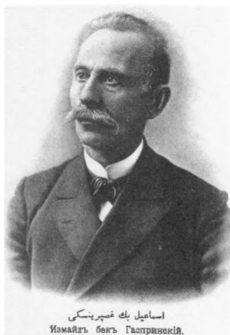
اسماعيل بك غسبرينسكى Исмаилъ бекъ Гаспринский.

Гаспринский яза: "Бу къадынларнынъ ве оларнен яшагъан эркеклерининъ аяты ве джесарети тербие ве фикир къадынларгъа чокъ джесарет, къувет ве къавийлик бермеге ве эркеклерден бу хусусиетлерини алмагъа олдыгъыны косътере эди."