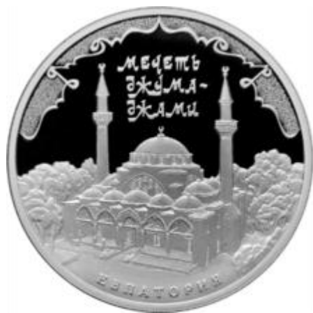
Мечеть Джума-Джами. Монета Банка России – Серия: «Памятники архитектуры России», серебро, 2016 г.

В годы советской власти мечеть была закрыта как религиозное учреждение и использовалась как склад сельскохозяйственной продукции, затем строительных материалов, с середины 80-х годов 20 века – памятник архитектуры и музей, в 1990-е годы мечеть была возвращена верующим. С октября 2015 г. мечеть Джума-Джами является объектом культурного наследия федерального значения. В 2016 г. Банком России выпущена серебряная монета в серии «Памятники архитектуры России», посвященная мечети.