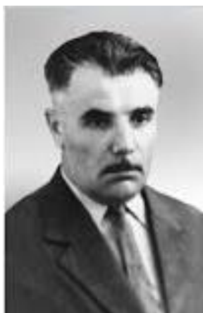
Шамиль АЛЯДИН (1912–1996)