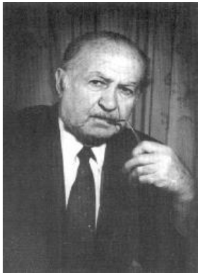
Идрис АСАНИН (1927–2007)

Поэт, общественный деятель, участник Национального движения крымских татар 95 лет со дня рождения