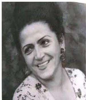
Сабрие ЭРЕДЖЕПОВА (1912–1977)