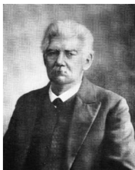
Василий Васильевич РАДЛОВ (1837–1918)