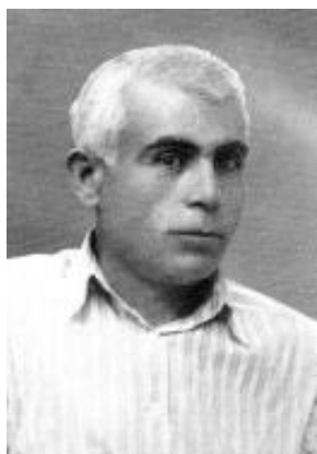
Усеин БОДАНИНСКИЙ (1877–1938)