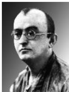
Умер ИПЧИ (Алкедай) (1897–1955)

После начала Великой Отечественной войны ушёл на фронт. В 1941 г. в воинском звании старшего сержанта погиб в бою в Донбассе.