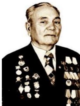
Абселям ИСЛЯМОВ (1907–1995)