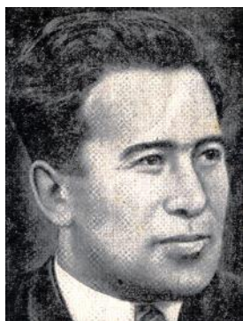
Амет МЕФАЕВ (1917–1976)