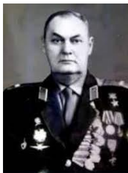
Абдраим РЕШИДОВ (1912–1984)