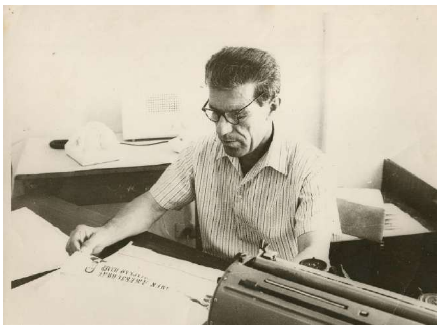
И. Паши «Ленин байрагъы» газетасынынъ обзорны азырлай. 1979 с.