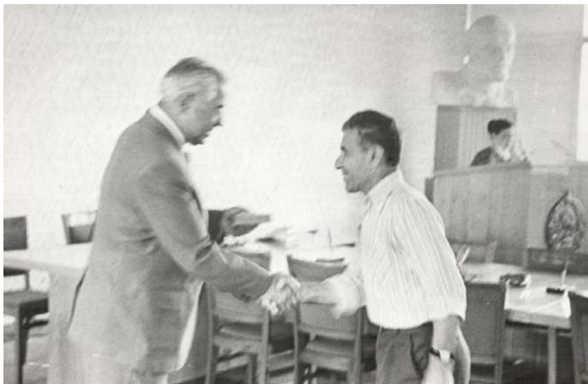
Озбекистан ССР Юкъары Советиниъ реиси И. Б. Усманходжаев Ибраим Пашиге Озбекистанда нам къазангъан медениет хадими нишаныны такъдим эте