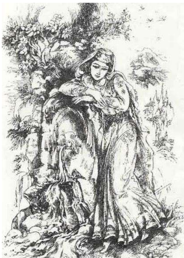
Легенда об Арзы кыыз