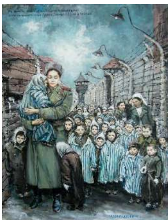
"Мадонна Освенцима" Худ. С. Седлачек

В сентябре 2024 года исполняется 85 лет со дня начала Второй мировой войны.