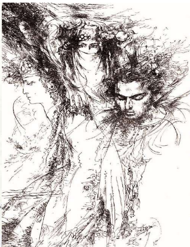
к Ашик Умеру