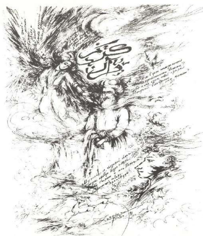
"Подражание Корану" А.С. Пушкина