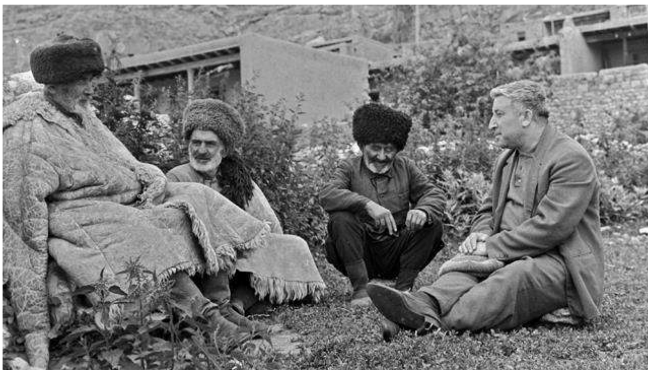
Расул Гамзатов беседует со старейшинами родного аула