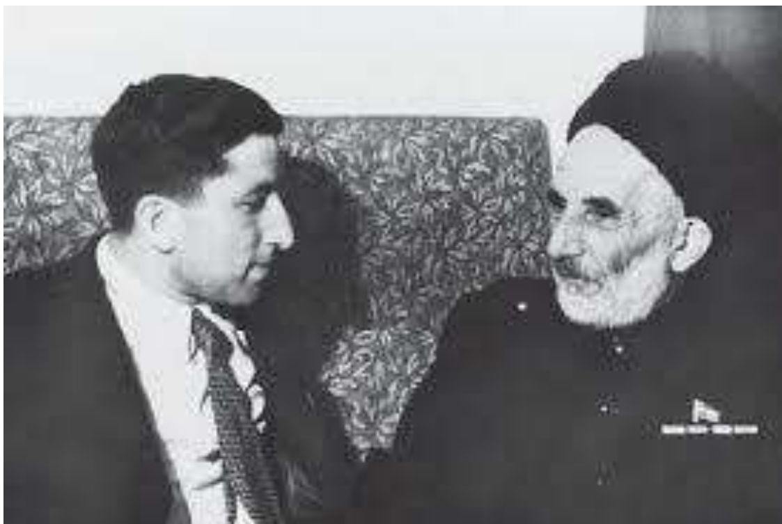
Расул Гамзатов с отцом