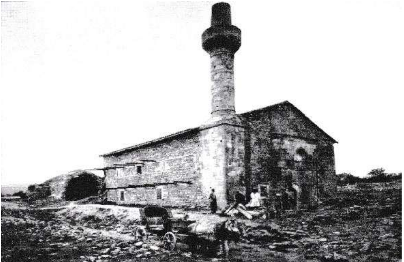
Мечеть Узбек-хана. 1890-е гг.