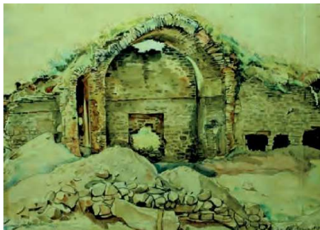
Раскопки в Старом Крыму (медресе, южный айван), акварель, К.Ф. Богаевский