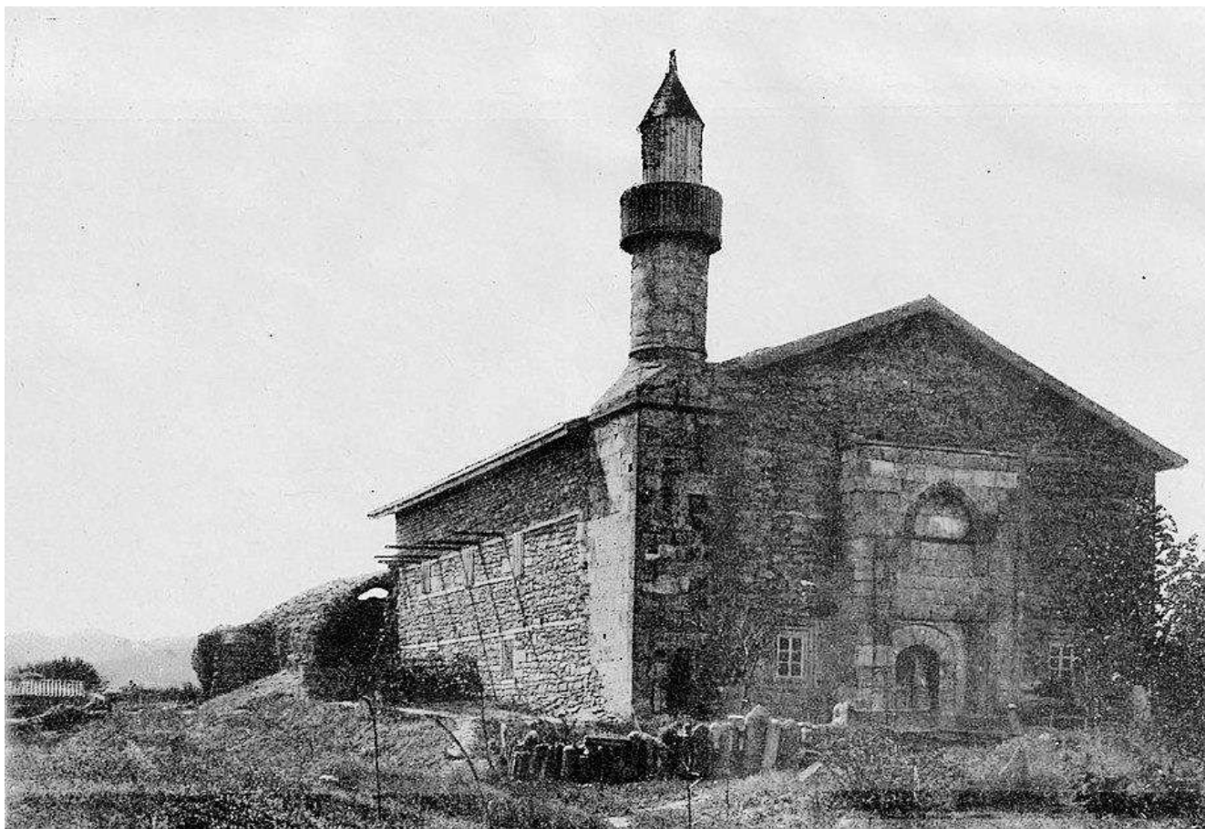
Мечеть в 1906 г., фотография Жозефа де Бая