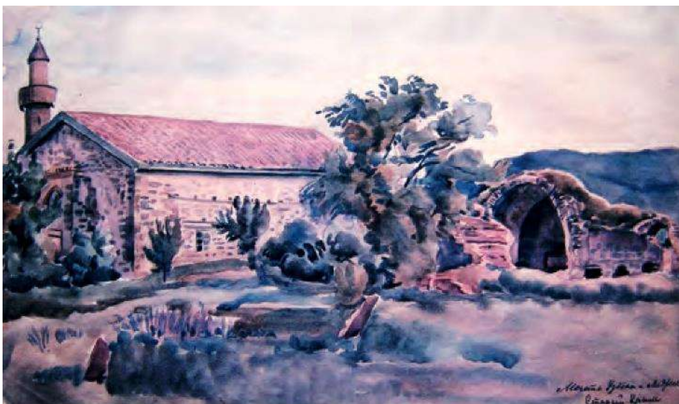
Мечеть Узбека и медресе в Старом Крыму, 1926г., акварель К.Ф. Богаевский