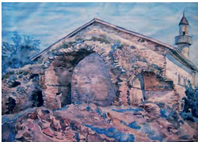
Руины медресе и мечеть Узбека в Старом Крыму, 20-е гг. XX в., акварель, К.Ф. Богаевский