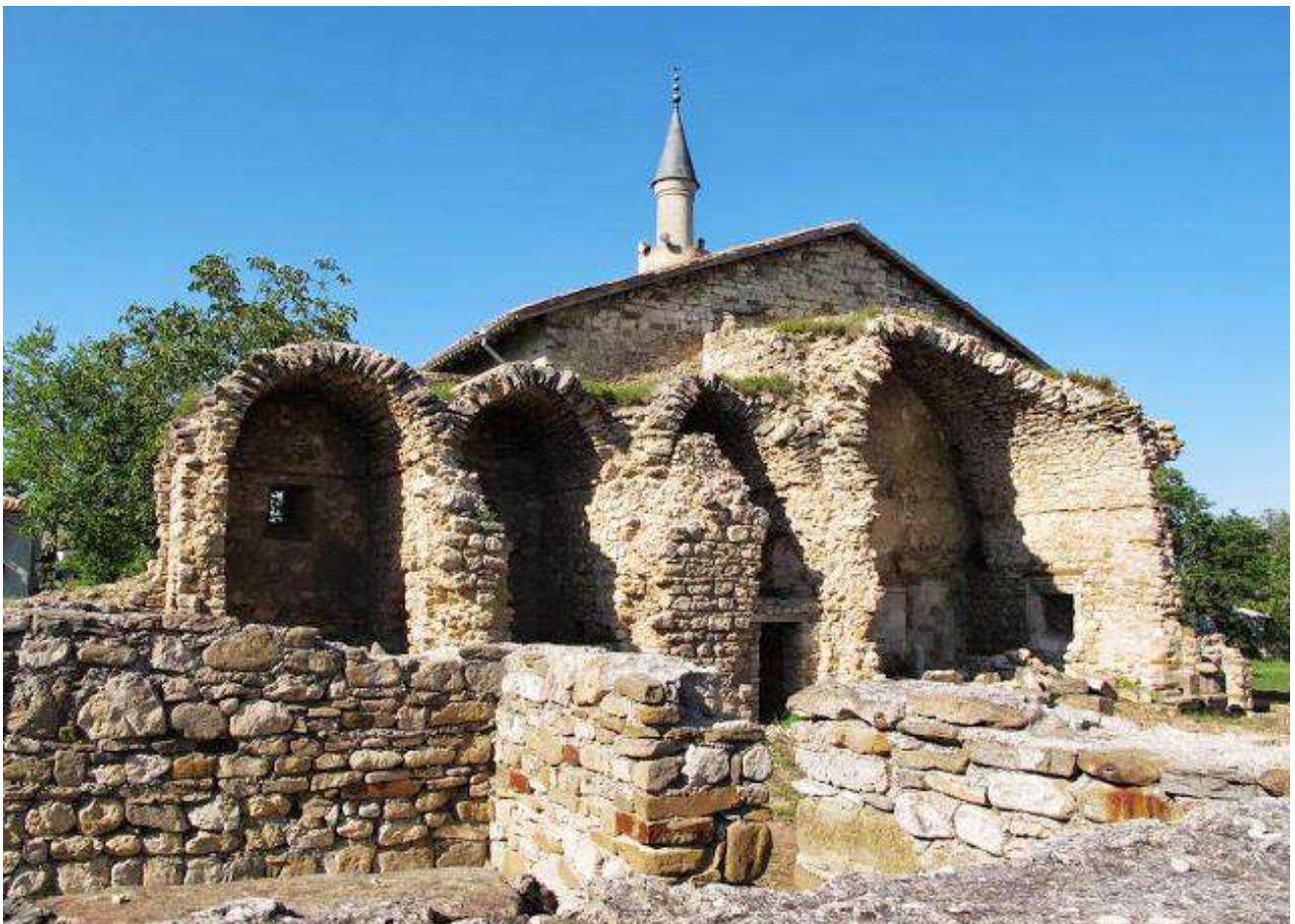
Современное состояние медресе при мечети Узбек хана