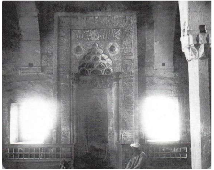
Михраб в мечети Узбек хана. 23 июля 1886г. в 9 часов утра.