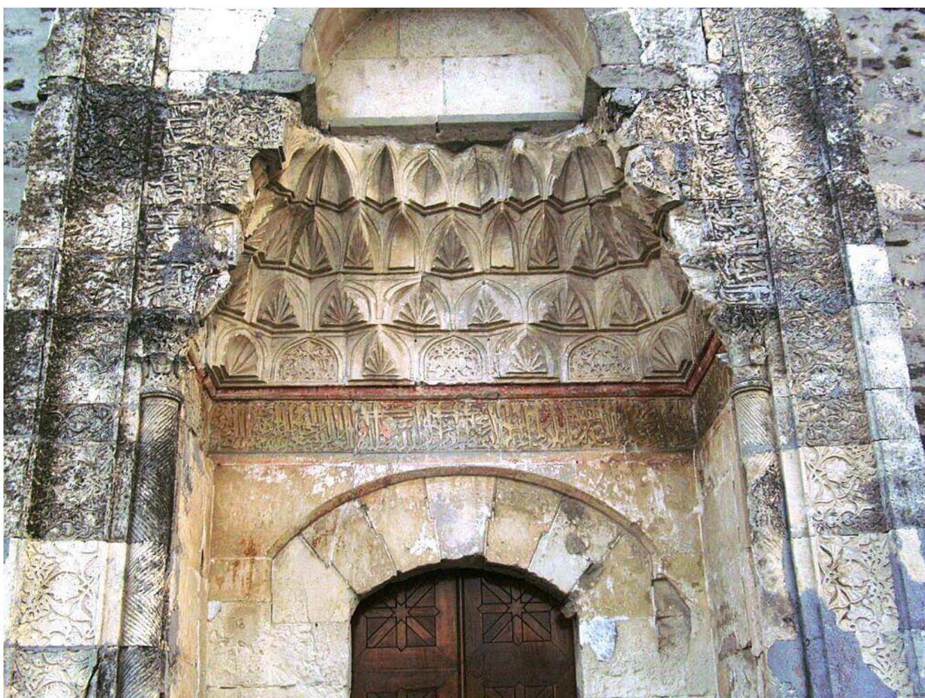
Резьба над входом в мечеть