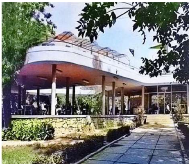
Кафе «Буратино» (Ташкент).