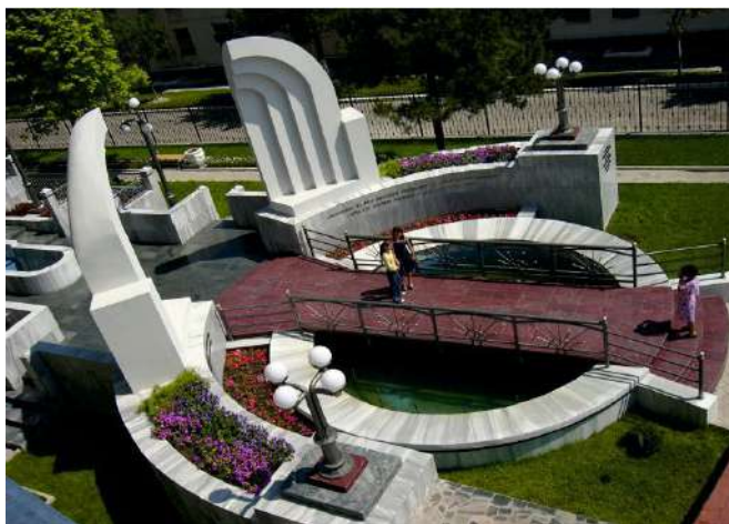
Скульптурно-пространственный комплекс «Возрождение».