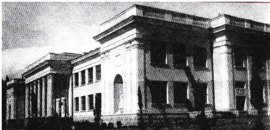
Школа на 400 учащихся в г. Ялта (1937 г.).