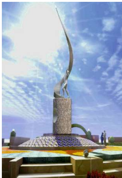
Памятный комплекс дважды Герою Советского Союза Амет-Хану Султану.