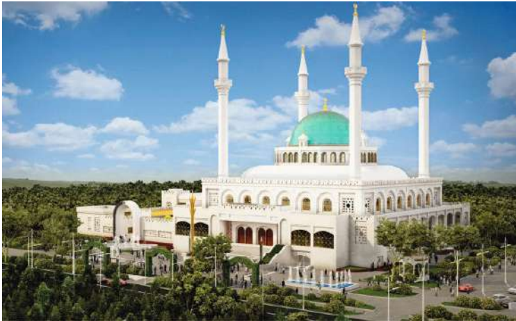
Соборная Мечеть «Джума – Джами».