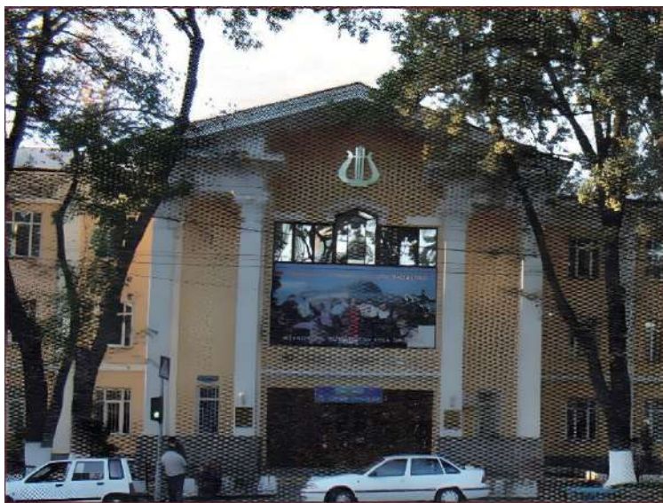
Реставрация консерватории, г. Ташкент. 1968 г.