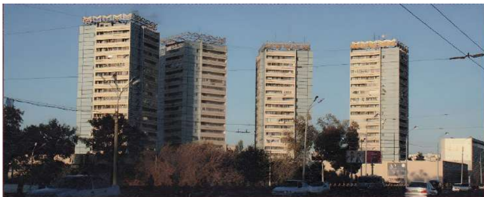
Жилая застройка по ул. Пушкина, г. Ташкент. 1968 г.