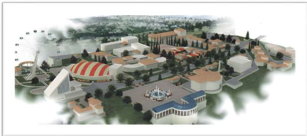
Международный туристический комплекс «Ай-Петри — Пристань облаков», г. Ялта. 2007 г.