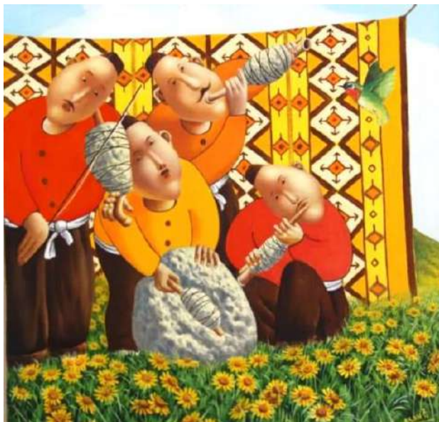
Музыканты (2010 г)