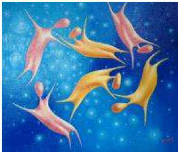
«Полет» (2016 г.)