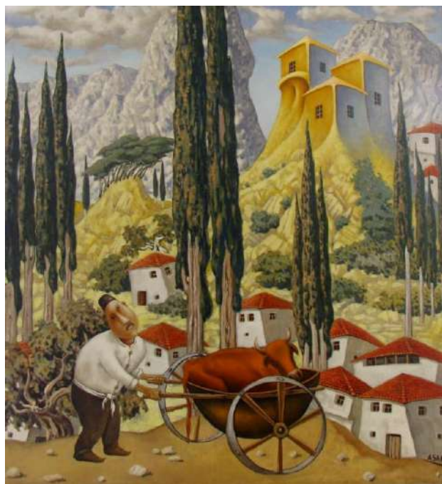
«Тойгъа» (2008 г.)