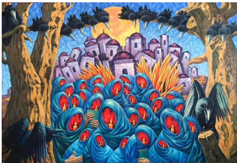
Козьяшлардан сёнмеди чыракълар (2020 г.) (От слез еще не погас огонь)