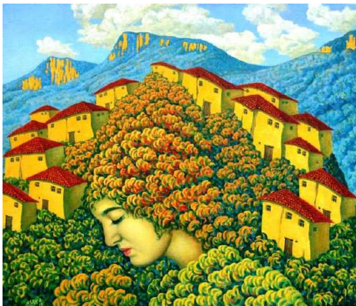
Буюк Озенбаш. (2015г.)