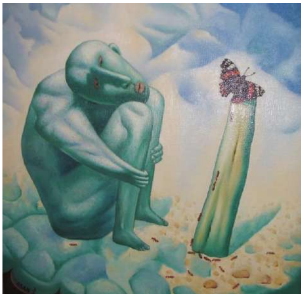
«Созерцатель» (2009 г.)